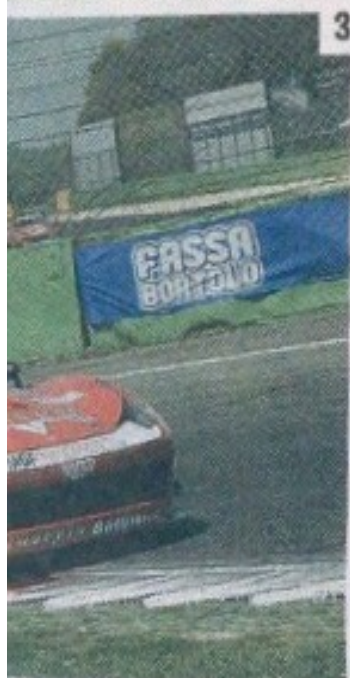
l'esordio della 13ª